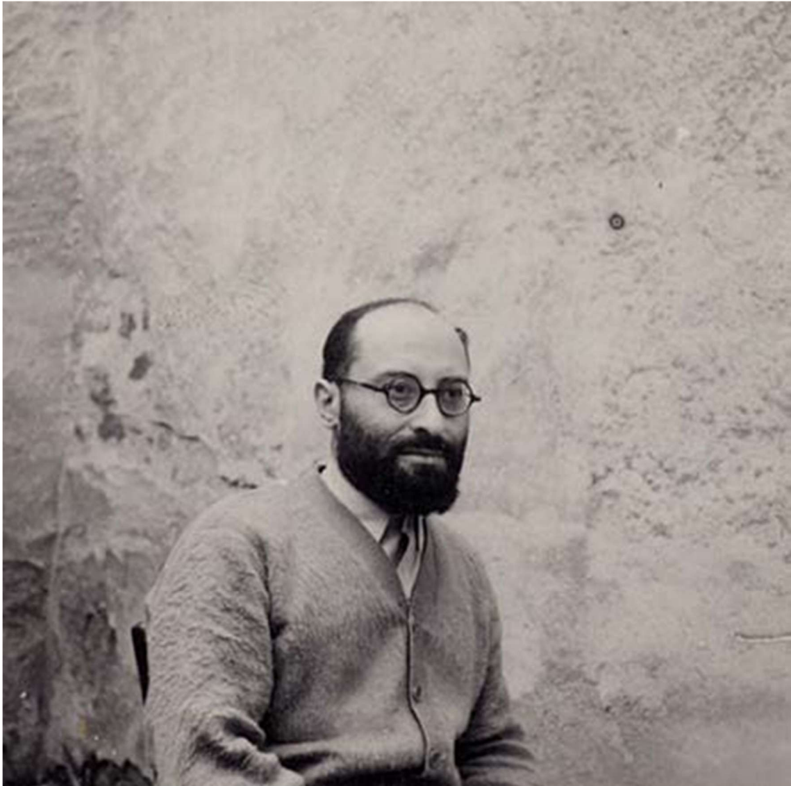
Jean Zay à la prison de Riom (1941)

Un film documentaire de Laurent VÉRAY – 1h38 Avec la voix d'Éric CARAVACA