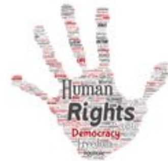
Violations des droits