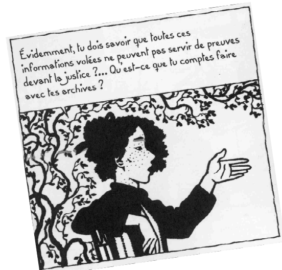
MINAVERY Ignacio R., « Chasseuse de nazis », Dora , tome 1, © L'Agrume, 2012.

12 reproductions de planches de bandes dessinées