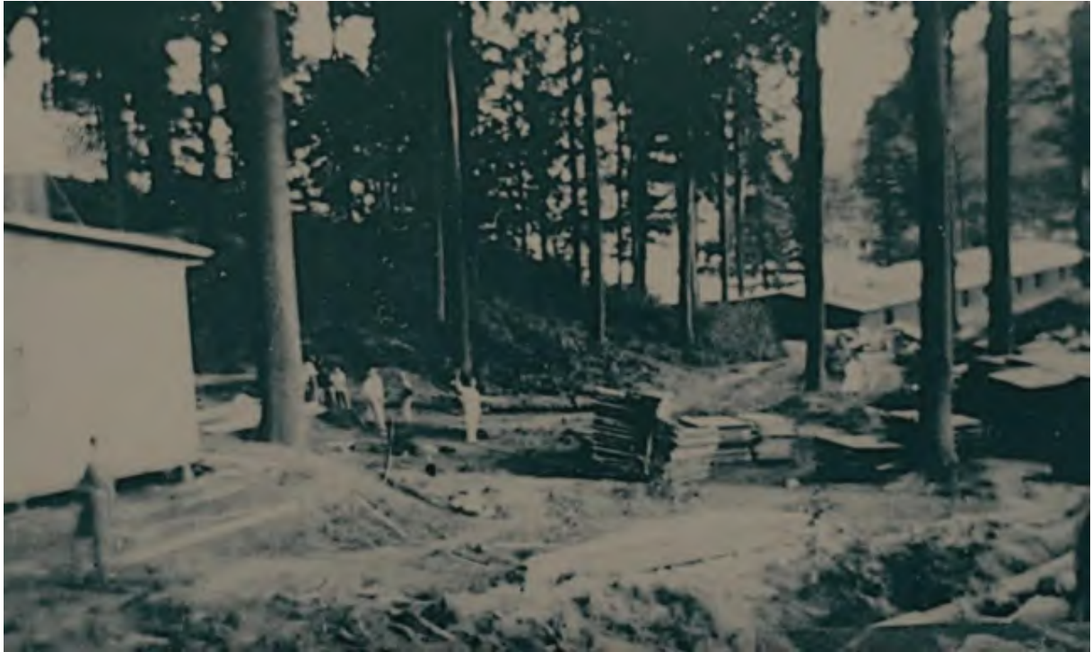
Wenzel Polak, 1944, Mittelbau-Dora, photographie du chantier dans les sous-bois.

Trois photographies sont prises en mouvement panoramique de gauche à droite. Elles montrent des travaux d'extension du camp dans la forêt. Les photographies sont prises à proximité d'une usine souterraine dans laquelle les détenus travaillaient nuit et jour comme des esclaves. Wenzel Polak a pu prendre ces photographies car le chantier dans les sous-bois était suffisamment loin des installations stratégiques du camp pour que la surveillance des SS y soit moins pressante.